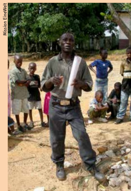
Das Programm UTT arbeitet in Liberia mit Kindern und Jugendlichen.

Liberia liegt im Westen Afrikas an der Atlantikküste. Von 1989 bis 2003 herrschte dort Bürgerkrieg. Mehr als die Hälfte der Bevölkerung wurde vertrieben. In unzähligen Auffanglagern fanden die Flüchtlinge Zuflucht. In den Wirren des Krieges und der Enge der Flüchtlingslager wurden Kinder und Jugendliche sich selbst überlassen. Die Lutherische Kirche in Liberia (LCL) gründete das Programm „Under the Tree“. Ehrenamtliche begannen, die Kinder unter dem Baum (under the tree) zu sammeln, um gemeinsam zu singen, zu spielen und zu beten.