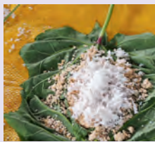
Sago und Pitpit