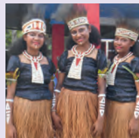
Röcke aus Sago-Fasern

Sago ist für viele Ethnien Westpapas das Grundnahrungsmittel. Der Sago-Wald wird von den Indigenen als „Familie“ betrachtet und leidenschaftlich geschützt. Sie lassen sich dabei von der Philosophie ‚Fi Ra Wali‘ (Mein Sago, mein Leben) leiten. Die Betonung dieser Idee bildet ein Gegengewicht zur Strategie Suhartos (Indonesiens zweiter Präsident), der Reis einführen ließ und dafür sorgte, dass seitdem Reisanbau durch die Regierung gefördert wird. Doch Indigene bevorzugen Sago. Zudem liefert Sago Material für die Herstellung von Kleidung und Schmuck. Beides wird heute bei Demonstrationen und selbst im Gerichtssaal getragen, um sich abzuheben von den indonesischen Symbolen, die schon Sukarno (Indonesiens erster Präsident) versucht hatte, den Menschen in Westpapua aufzuzwingen.