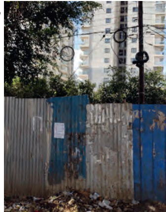
Ganz weit offen: die Schere zwischen Arm und Reich in Kenias Hauptstadt Nairobi.

die seines Stellvertreters war genug Geld da. Auch für Steuerbefreiungen auf Hubschrauber und Privatflugzeuge.