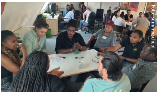
Rauchende Köpfe für Klimagerechtigkeit: volle Konzentration beim Workshop im Nürnberger Büro.