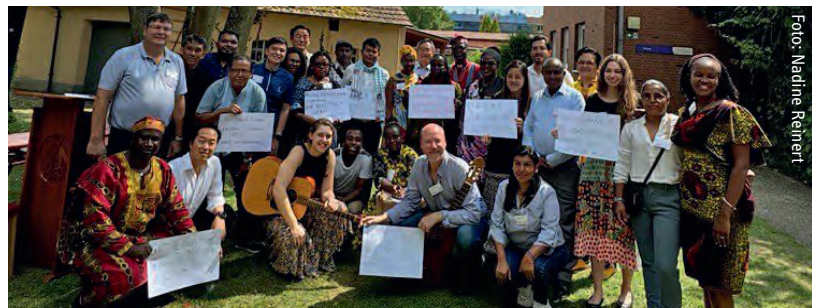
Und jetzt nochmal alle: Gruppenfoto der Summer School-Teilnehmenden nach dem Auftritt beim Fest der weltweiten Kirche.