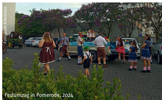
Festumzug in Pomerode, 2024

Dieses Engagement prägte eine Region in Brasilien so stark,