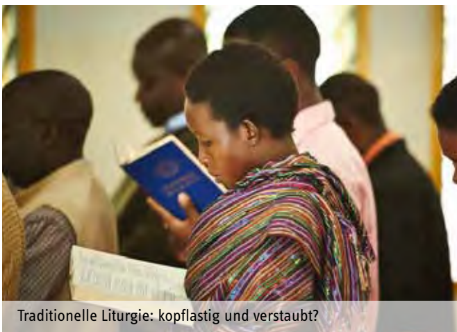
Traditionelle Liturgie: kopflastig und verstaubt?