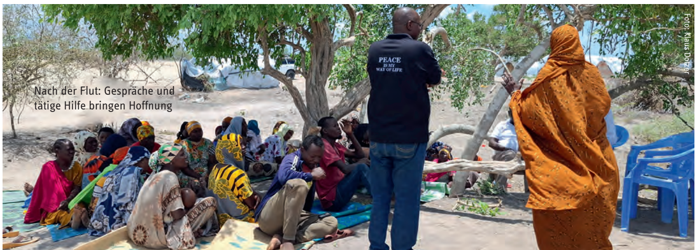
Nach der Flut: Gespräche und tätige Hilfe bringen Hoffnung