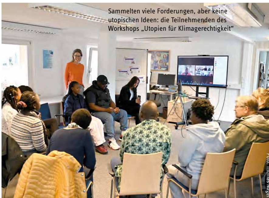
Sammelten viele Forderungen, aber keine utopischen Ideen: die Teilnehmenden des Workshops „Utopien für Klimagerechtigkeit“

Dann war die aus internationalen Studierenden und Menschen verschiedener Herkunft und aller Altersgruppen bunt zusammengesetzte Gruppe der Teilnehmer*innen der WeltUni, gefragt,