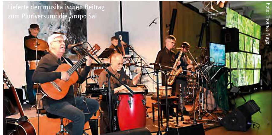
Lieferte den musikalischen Beitrag zum Pluriversum: die Grupo Sal

Es gibt euphorisierendere Anfänge für Präsentationen: „Die Situation in der Welt verschlechtert sich jeden Tag“, resümierte der Wirtschaftswissenschaftler Alberto Acosta, Begründer der „Buenavivir“-Bewegung und ehemaliger Spitzenpolitiker in Ecuador, zum Auftakt des „Pluriversums“ am 19. April 2024 im Nürnberger