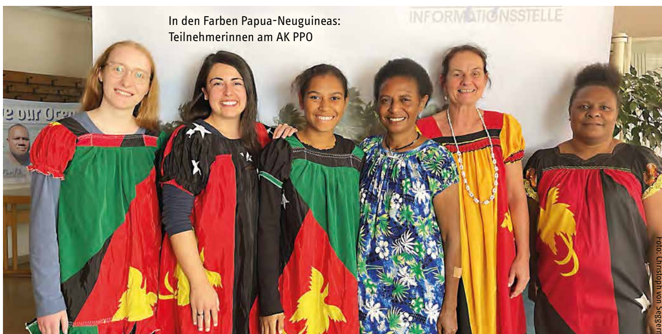
In den Farben Papua-Neuguineas: Teilnehmerinnen am AK PPO